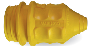
Capuchon étanche Réf: BG004 pour 30A Réf: BG717 pour 50A