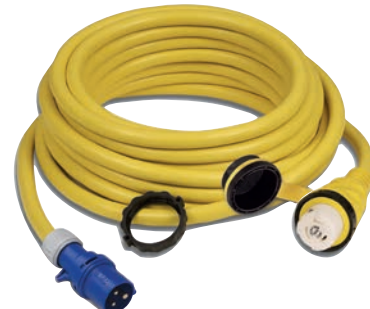
Rallonge 2P+T 32A 230V (50A 125V) Réf: BG013 Rallonge complète (15m)