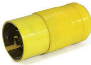
Réf: BG365 3P+T 50A 125/250V