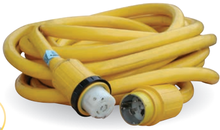
Rallonge 3P+T 50A 230V Réf: BG152 Rallonge complète (15m)