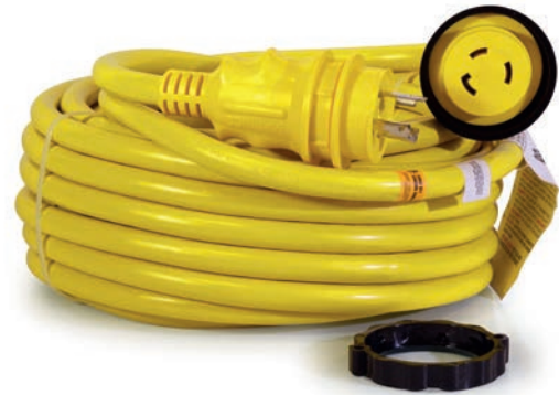
Rallonge 2P+T 16A 230V (30A 125V) Réf: BG050 Rallonge complète (15m) Réf: BG110 Adaptateur