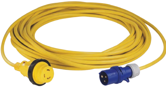
Cordon d'adaptation CEE 2P+T 230V 16A . Réf: BG007 0,45m Réf: BG011 25m