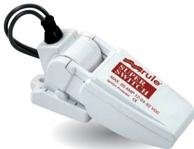
Réf: RL037 Contacteur Courant max : 20A à 12V, 10A à 24V. Dim: L 127 x l 54 x H 66. Base amovible.