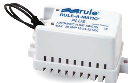
Réf: RL040 Contacteur Courant max : 20A à 12V, 10A à 24V. Dim: L 133 x l 54 x H 73.