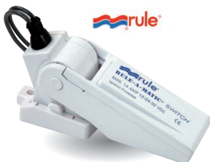
Réf: RL035 Contacteur Courant max : 14A à 12V, 7A à 24V. Dim: L 127 x l 44 x H 66. Base amovible.