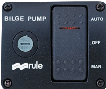
Tableau de commande 3 positions : AUTO / OFF / ON MAN Porte fusible et témoin de fonctionnement Dimensions : 60 x 73mm Réf: RL043 12V 20A max Réf: RL044 24V 10A max

Réf: RL045 Tableau 3 positions 20A Dimensions : 57 x 51 mm.