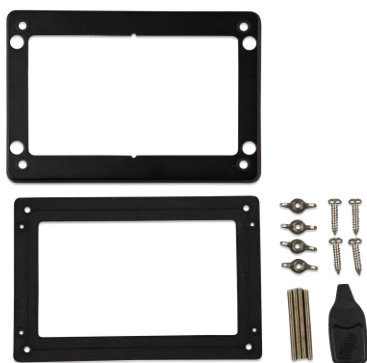
Accessoires inclus avec le GX Touch