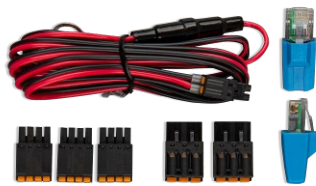
Accessoires inclus avec le Cerbo GX

Le Cerbo GX est facile à monter et peut aussi être monté sur un rail DIN à l'aide de l'adaptateur DIN35 small (non inclus). Son écran tactile séparé peut être boulonné sur un tableau de bord, éliminant ainsi la nécessité de réaliser des coupes exactes (comme avec le Color Control GX). Comme il se connecte facilement avec un seul câble, vous n'aurez pas à amener de nombreux fils jusqu'au tableau de bord. La fonction Bluetooth permet une connexion et une configuration rapides avec notre application VictronConnect.